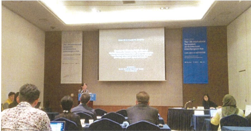
アカデミック・セッションでの発表の様子