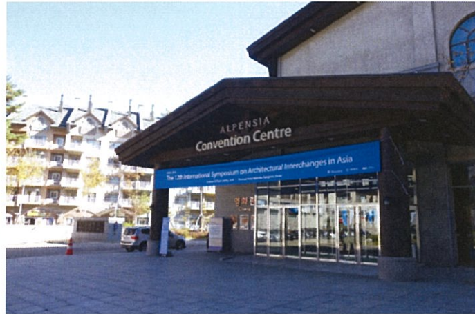
（左）会議会場での写真、（右）会場となった Pyeongchang Alpensia Convention Centre